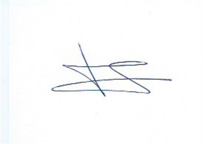
Françoise Grellier Le 2 janvier 2015